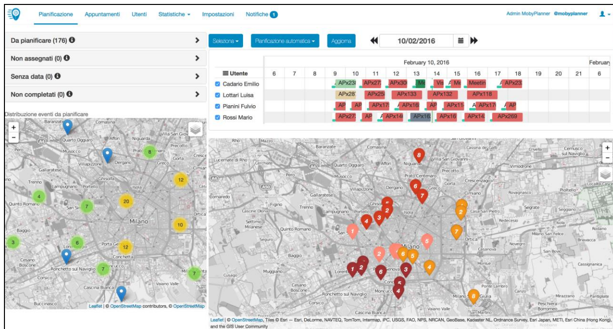
Figura 1. Interfaccia di pianificazione con itinerari calcolati

Tutte le informazioni degli itinerari sono rappresentate in una unica interfaccia a disposizione del coordinatore (Fig. 1) da cui è possibile effettuare anche modifiche manuali.